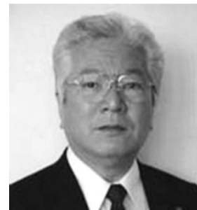
義援金の協力や特別経営相談窓口の設置に取組む宍倉会頭(市原商工会議所)

金募金を行う予定である。また、当所会員についても、事業所の破損などの直接的な被害に加え、計画停電やガソリン等の不足などの間接被害が危