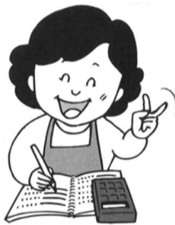
帳簿をつける時の心得